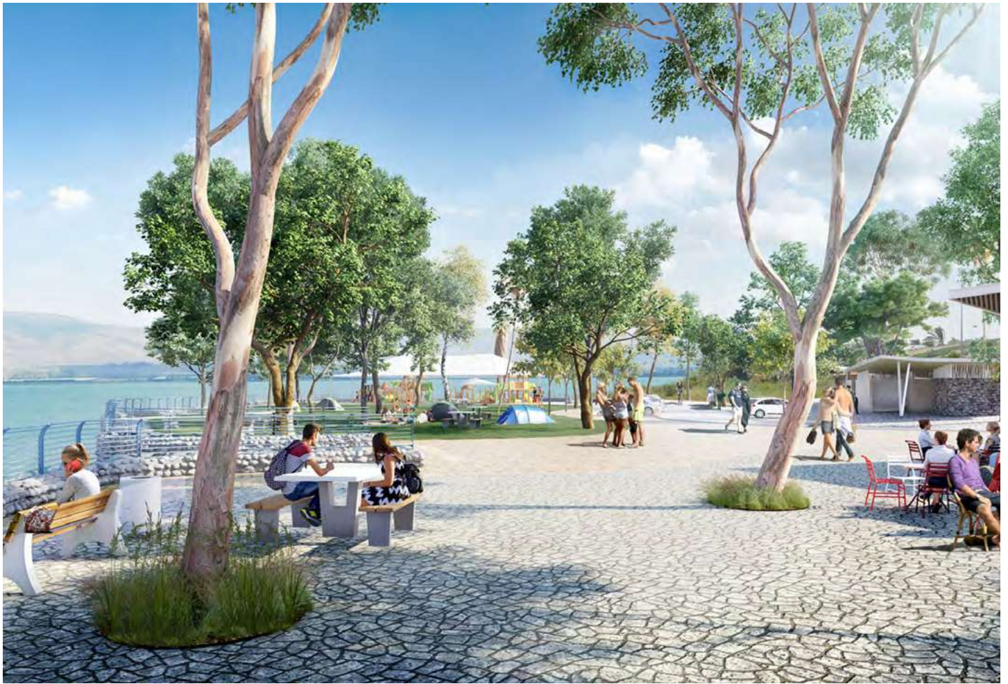
הדמיות: חב' גרינשטיין הר-גיל לאדריכלות נוף ותכנון סביבתי

חדשה - "רצועת התנוודות" הגובלת במי הכינרת, שאינה מפותחת והשימוש בה מועט. התוכנית שלאורה מתבצע התכנון שלנו היא תוכנית המתאר הארצית המפורטת תמ"א 13/13'א' שהליך תכנונה החל לפני כעשר שנים, עם הקמת איגוד ערים כינרת ואשר נכנסה לתוקפה לפני כשנתיים.